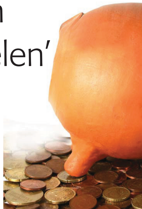
Inzetten op gezondheid levert geld op

van een bedrijf te maken, onderzoeken welke 'stakeholders' er zijn en hoe je rekening houdt met veranderkundige principes. Volgens Stam is de opzet efficiënt, er wordt uitgegaan van 'action learning' (van elkaar leren door het bespreken van praktische problemen). Het hele traject duurt een half jaar. In die periode zijn 15 dagdelen verdeeld over 5 volle dagen. De deelnemers krijgen tijdens de module veel informatie en werken gedurende het hele traject aan een case uit de praktijk. Het examen van de leergang bestaat uit het schrijven van een masterplan over de case. Tussen elke module zit een maand, waarin cursisten de gelegenheid krijgen om hun plan uit te werken. Ze krijgen dan feedback van de docenten en weten zo zeker dat ze bij de start van de volgende module verder kunnen. 'Het voordeel van deze aanpak is dat studenten niet aan het einde nog eens keihard moeten blokken, maar